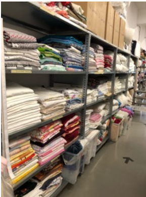
Abteilung Bettwäsche ....

Beispielsweise war das CaFée mit Herz für sein neues Wohnprojekt, in dem obdachlose Menschen endlich wieder ein Zuhause finden sollen, noch auf der Suche nach Möbeln. Wegen eines sehr dringenden Falls benötigte das fürsorgliche Team bereits früher als geplant Hausrat für eine der Wohnungen – und konnte bei uns fündig werden.