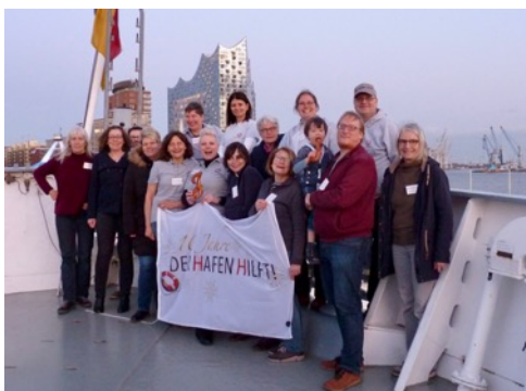
Das leckere Laugen -„J“ schaffte es noch aufs Foto, verschwand dann aber unter ungeklärten Umständen. Verdächtig wird unsere jüngste Hafен-Helferin.

Im Schützlinge-Wettbewerb 2020 der Bäckerei JUNGE waren wir erfolgreich. Mit den 2000 € Preisgeld möchten wir einen Container kaufen, den wir bei Blohm + Voss auf dem Werftgelände abstellen und als Zwischenlager für Spenden von Schiffen nutzen wollen.