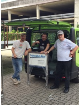
Auch das TUI-Trim-Dich-Pfad-Schild Hat nun seinen Einsatzort in Hessen.

In den letzten Monaten konnten wir mehrere große Spendenaktionen koordinieren. Schon im Juli und August gab es von der Deutschen Bahn am Hachmannplatz Büromöbel für mehr als 20 gemeinnützige Organisationen. Dann bot uns der Luftfahrtienstleister AHS die komplette Ausstattung seiner sechs Mitarbeiterwohnungen an. Die Möbel und der Hausrat fanden über unser Netzwerk schnell neue Einsatzorte. Richtig ins Schwitzen brachten die Fitnessgeräte der MEIN-SCHIFF-Flotte: erst die Hafен-Helfer beim Transport aus Bremerhaven nach Hamburg, dann die neuen Nutzer in der Pontonwohnanlage von Gangway e.V. sowie die Gäste eines kirchlichen Jugend-Tagungshauses in Hessen!