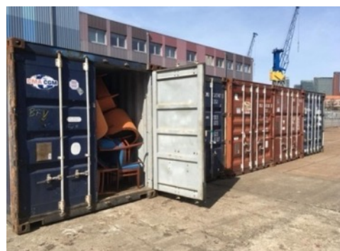
... unsere Schachtel“ wird die schönste auf der Werft sein! ☺