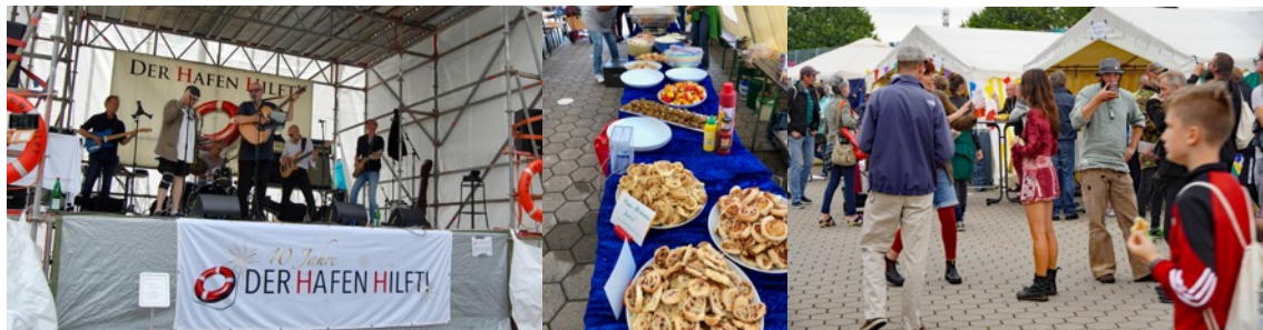
Livemusik von Anfang bis Ende