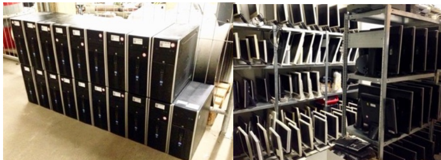
... so sehen IT-Ausrüstungs-Berge aus

Über 500 PCs, Monitore und Zubehör gingen von Hamburg Wasser und Blohm+Voss an unsere Kooperationspartner Nutzmüll e.V., Mook Watt e.V. und das SOS Dorf Bockum- wir geben wiederum die überprüften Sets weiter – z. B. an StraSo Schlupfloch aus Rahlstedt.