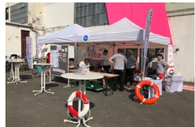
Zusammen mit Hanseatic Help vor