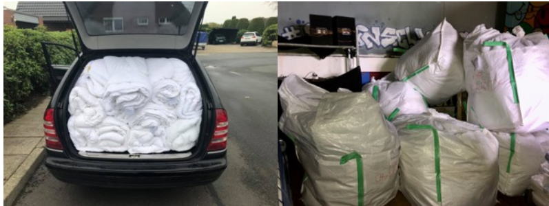
Eine Kombi-Ladung mit Decken (45 Stück!) für ein Sucht- und Therapiezentrum