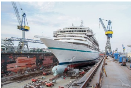
Die MS AMERA im Dock von Blohm+Voss