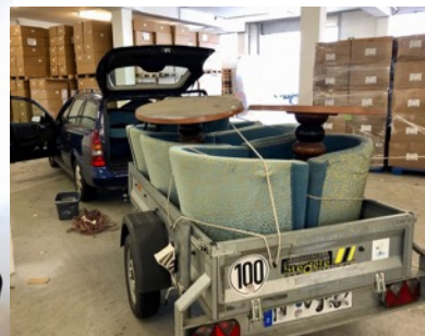
Cocktailsessel und Tische auf dem Weg zu einer Jugendeinrichtung