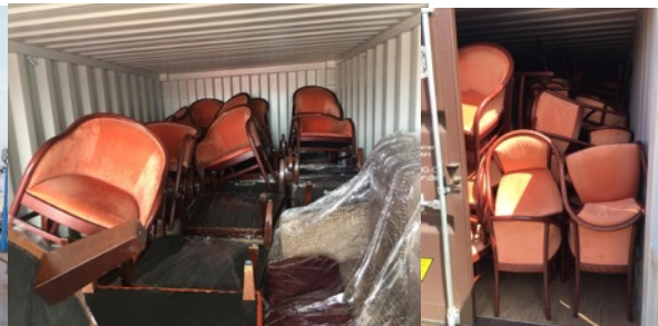
2 von 6 Containern mit Mobiliar, das uns geschenkt wurde

DER HAFEN HILFT! e.V. c/o DNS Factory Hermann-Blohm-Straße 3 20457 Hamburg